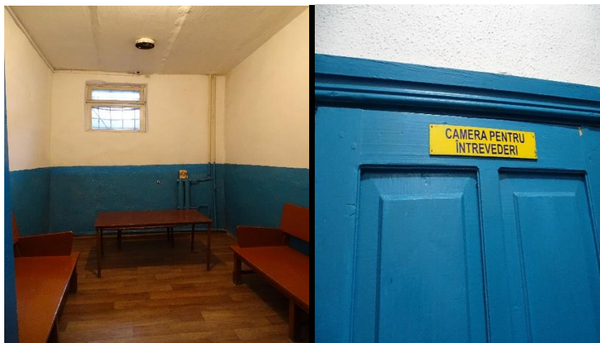
Foto 1,2 Biroul de audieri și întrevederi al IDP Drochia

Întrevederile și consultațiile cu avocatul au loc în cadrul unui birou care este dotat cu cameră video de supraveghere, situație care încalcă principiul confidențialității întrevederilor cu apărătorul.