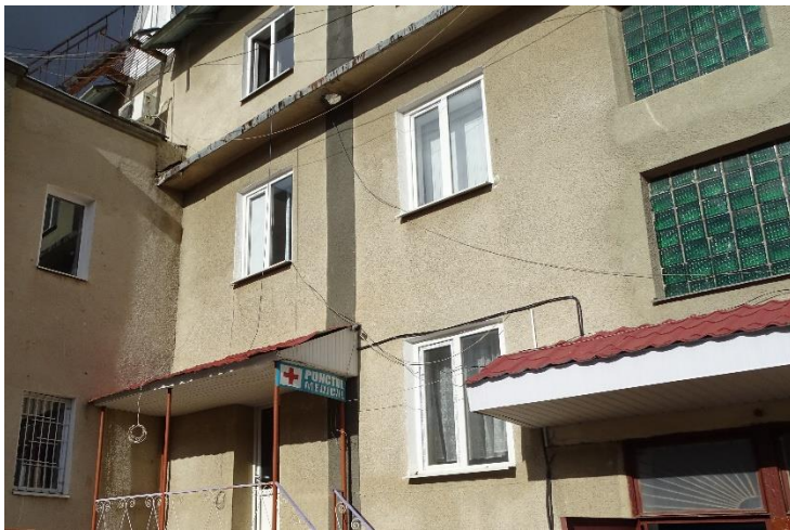
Foto 3 Punctul medical IDP Drochia

IDP Drochia dispune de un Punct medical separat, aflat la intrarea în izolator prin curtea instituției. Registrul medical privind examinarea persoanelor parvenite în custodia poliției se păstrează doar aici, și confidențialitatea datelor cu caracter medical este asigurată de către angajatul medical al instituției.