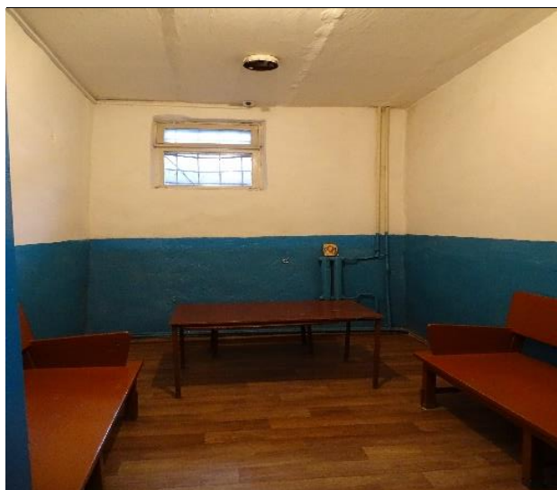
Foto 5 Biroul audiere IDP Drochia

Astfel, prin dotarea cu cameră video, și respectiv presupusa monitorizare a întrevederilor, se încalcă standartul CPT conform căruia dreptul de acces la un avocat al unei persoane aflate în custodia poliției trebuie să includă și dreptul de a-l întâlni în particular. Ca o măsură de siguranță împotriva maltratării (diferită de mijloacele de a asigura un proces corect), este esențial ca avocatul să se afle în prezență fizică directă cu deținutul. Acesta este singurul mod de a putea face o evaluare fizică și psihologică corectă a stării persoanei în cauză. De asemenea, dacă întâlnirea cu avocatul nu are caracter privat , este posibil ca persoana deținută să nu se simtă liberă să dezvăluie maniera în care este tratată. Dacă s-a acceptat, în mod excepțional, ca avocatul respectiv să nu fie cel ales de persoana deținută, ci un avocat înlocuitor, ales în urma unei proceduri stabilite dinainte de comun acord, CPT nu vede necesitatea derogării de la confidențialitatea întâlnirilor între avocat și persoana în cauză. 10