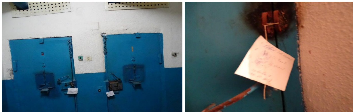
Foto 6, 7 Celule sigilate IDP Drochia

În rezultatul vizitei de monitorizare la IDP Drochia, echipa IDOM a constatat că celulele nefuncționale sunt sigilate prin sigiliu simplu, care la necesitate ar putea fi ușor deteriorat și apoi înlocuit. Totodată, careva motive de a prezuma că acestea au fost utilizate nu au putut fi constatate.