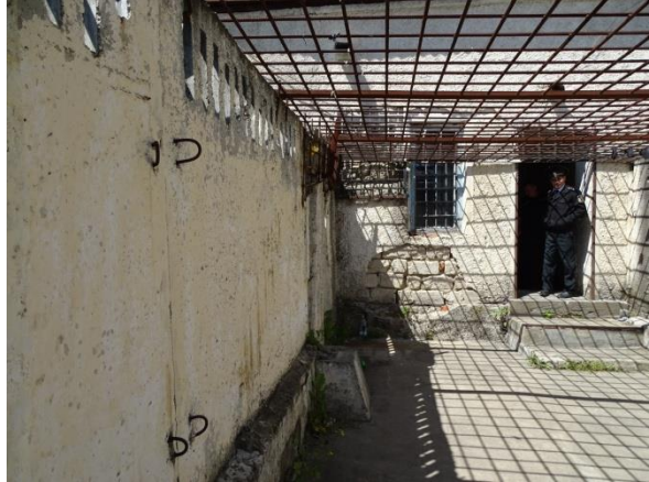
Imagine nr. 7