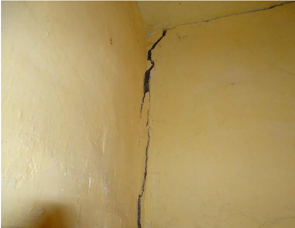
Imagine nr. 5