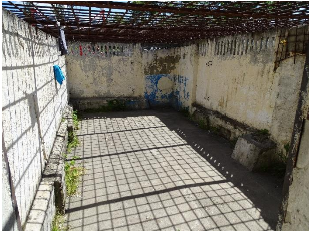
Imagine nr. 6